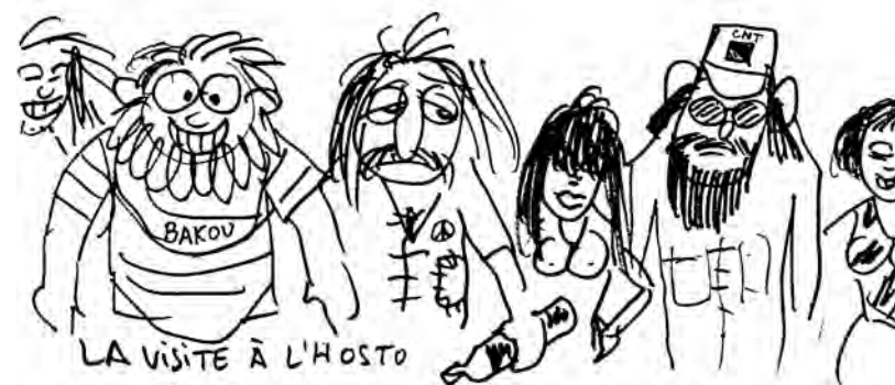
Au camping libertaire de Saint-Mitre-les-Remparts. Dessins de Christian Lagant.