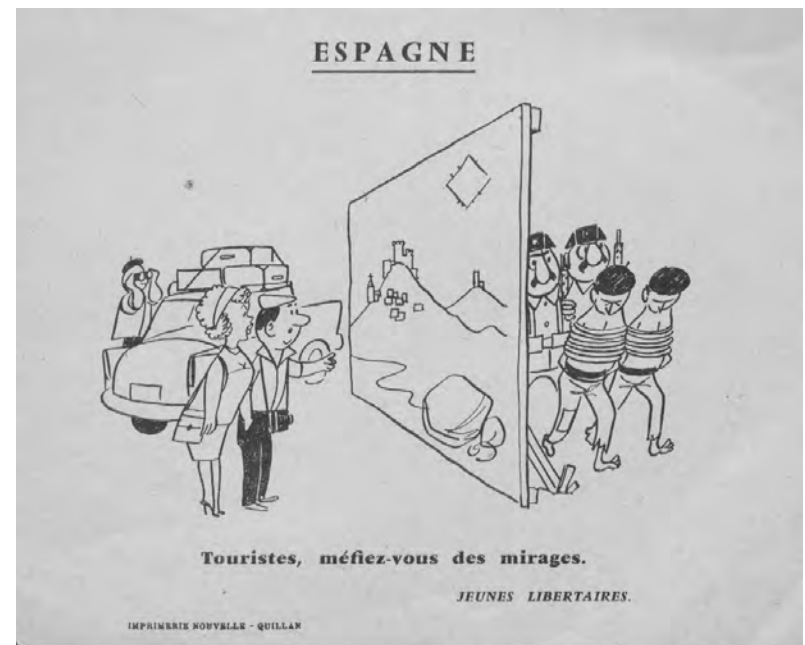
Papillons contre le tourisme en Espagne diffusés en France vers 1960, avant l'invention des autocollants.